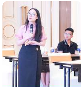
Team: Kinh doanh thị trường Việt Nam Email: hello@cnctech.vn