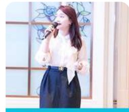
USA Team: Kinh doanh thị trường Mỹ Email: hello@cnctech.vn