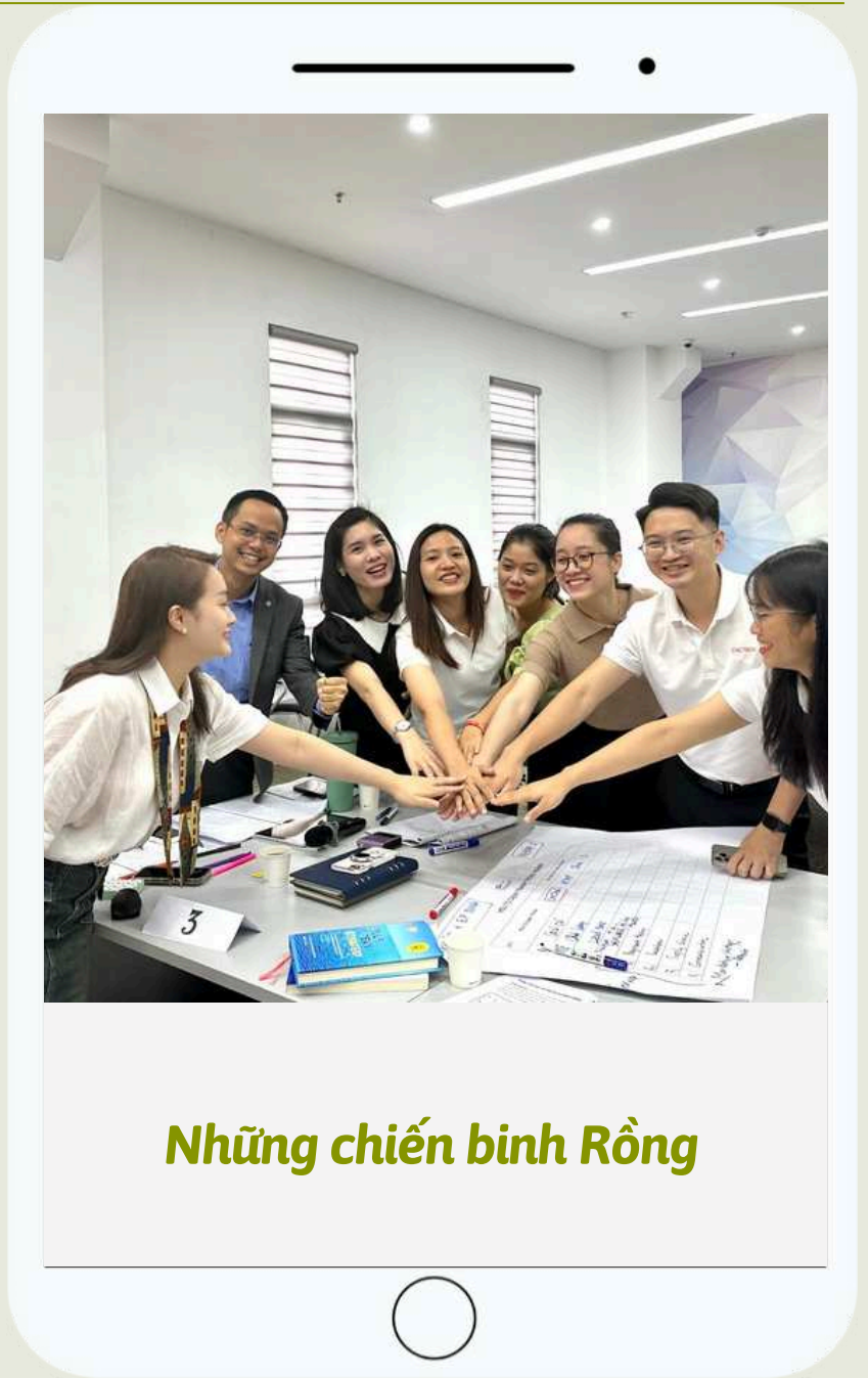
Những chiến binh Rông