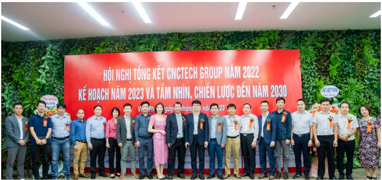
Ban lãnh đạo CNCTech Group và khách mời đặc biệt tại Hội nghị.

Ngày 25/3 vừa qua, Hội nghị Tổng kết năm 2022, kế hoạch hoạt động năm 2023 và tầm nhìn chiến lược CNCTech Group đến năm 2030 được diễn ra thành công tốt đẹp.