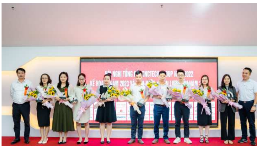
Cán bộ nhân viên xuất sắc nhất 2022

Người CNCTech – những con người có khát vọng mới – mạnh dạn, đổi mới, tạo đột phá, sẽ luôn đồng lòng để cùng hướng tới những mục tiêu mới, hy vọng mới và thành công mới.