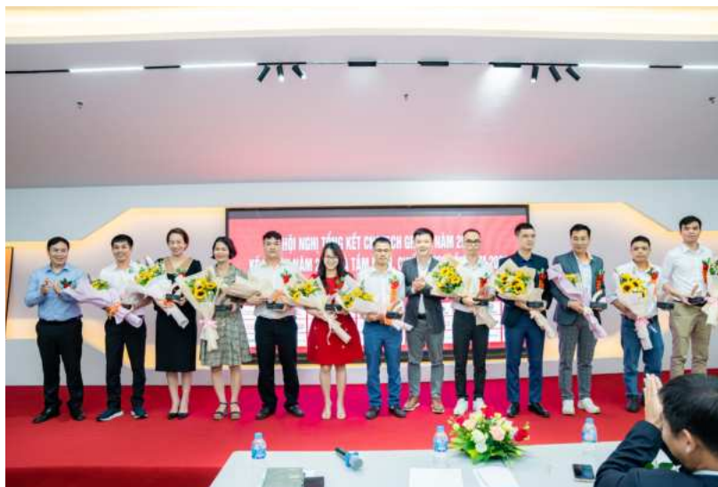
Quản lý xuất sắc nhất của CNCTech Group 2022

Nhân dịp này, CNCTech đã trao kỉ niệm chương và hoa tuyên dương Tập thể xuất sắc, Quản lý xuất sắc và Nhân viên xuất sắc năm 2022.