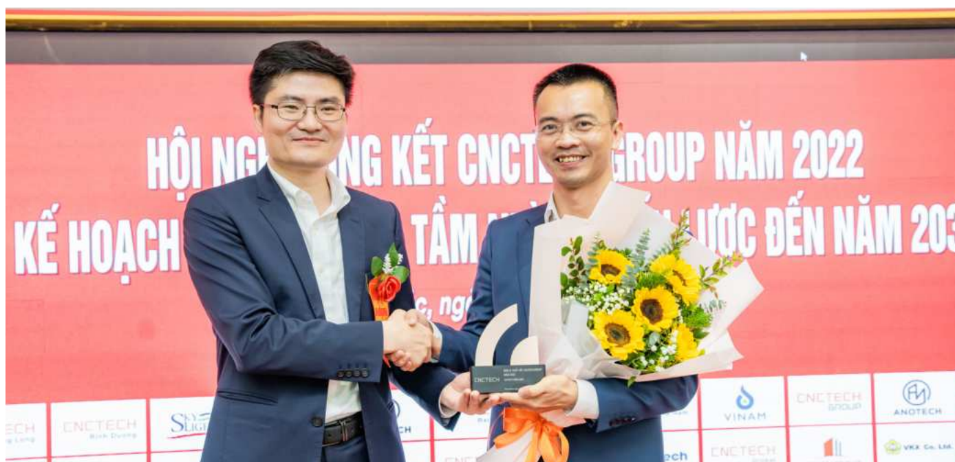
CNCTech Thăng Long vinh dự là đơn vị xuất sắc nhất CNCTech 2022

Người CNCTech – những con người có khát vọng mới – mạnh dạn, đổi mới, tạo đột phá, sẽ luôn đồng lòng để cùng hướng tới những mục tiêu mới, hy vọng mới và thành công mới.