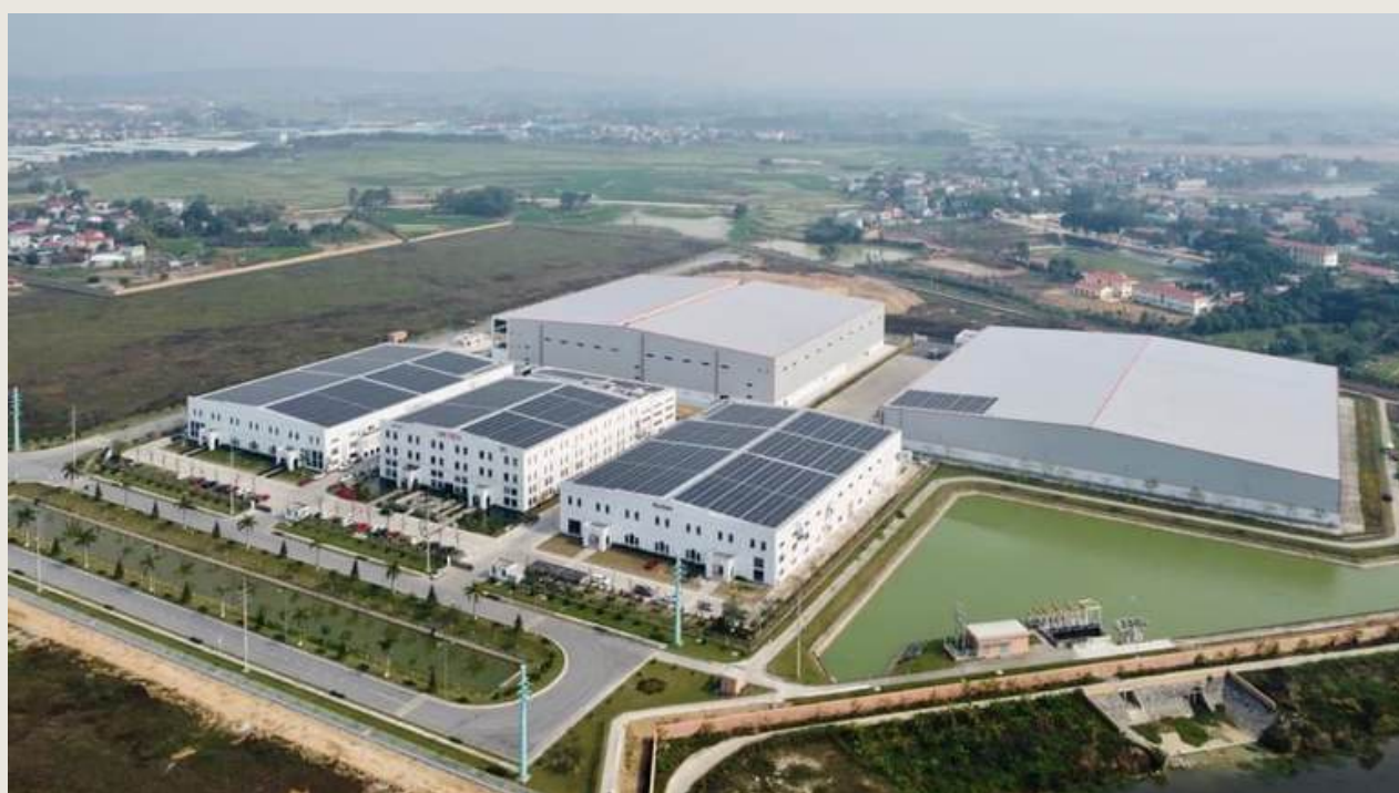
CNCTech Thăng Long nằm trong Tổ hợp CNCTech Complex tại Khu Công nghiệp Thăng Long 3 - Bình Xuyên - Vĩnh Phúc

Hoàn thành xuất sắc KPI của năm 2022, CNCTech Thăng Long xứng đáng được vinh danh là "Đơn vị xuất sắc của CNCTech năm 2022".