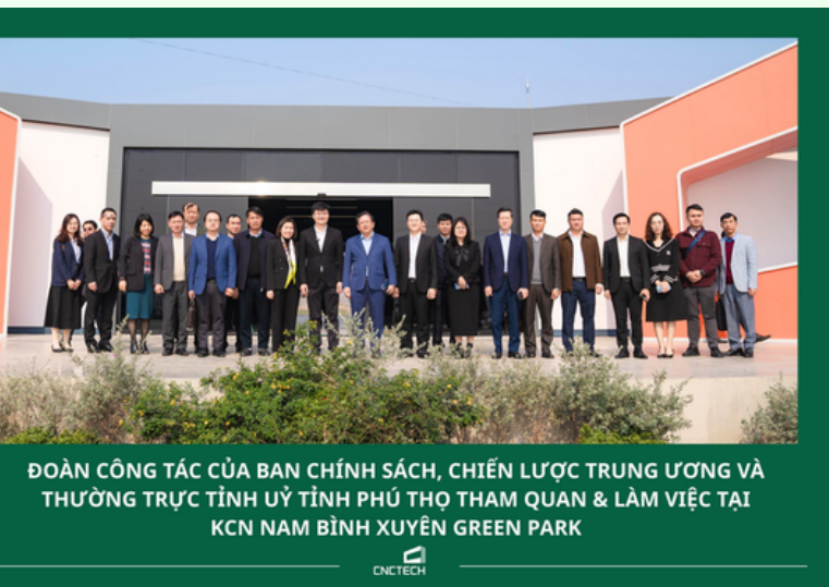
ĐOÀN CÔNG TÁC CỦA BAN CHÍNH SÁCH, CHIẾN LƯỢC TRUNG ƯƠNG VÀ THƯỜNG TRỰC TỈNH ỦY TỈNH PHÚ THỌ THAM QUAN & LÀM VIỆC TẠI KCN NAM BÌNH XUYỀN GREEN PARK